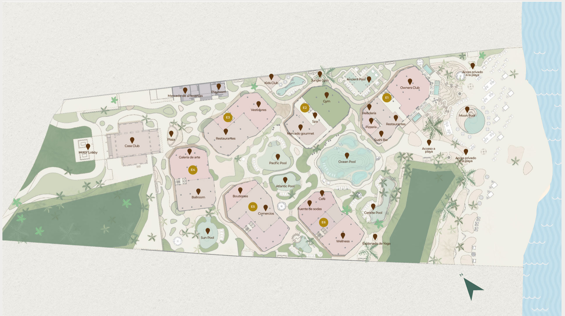
MASTER PLAN DE COSTA RESIDENCES & BEACH CLUB