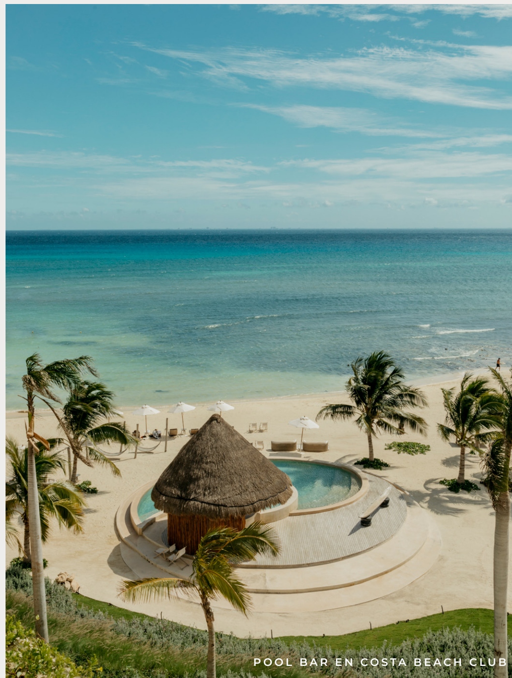
POOL BAR EN COSTA BEACH CLUB

Acceso Privado a la Playa Alberca cenote SPA Galería de arte Kids Club Boutiques Mercado de artesanías Lounge Mercado gourmet Casa club Restaurantes Albercas familiares Sushi bar Alberca de adultos Fuente de sodas Tiendas Cafetería Restaurantes de clase mundial Heladería Owner's club Fitness studio