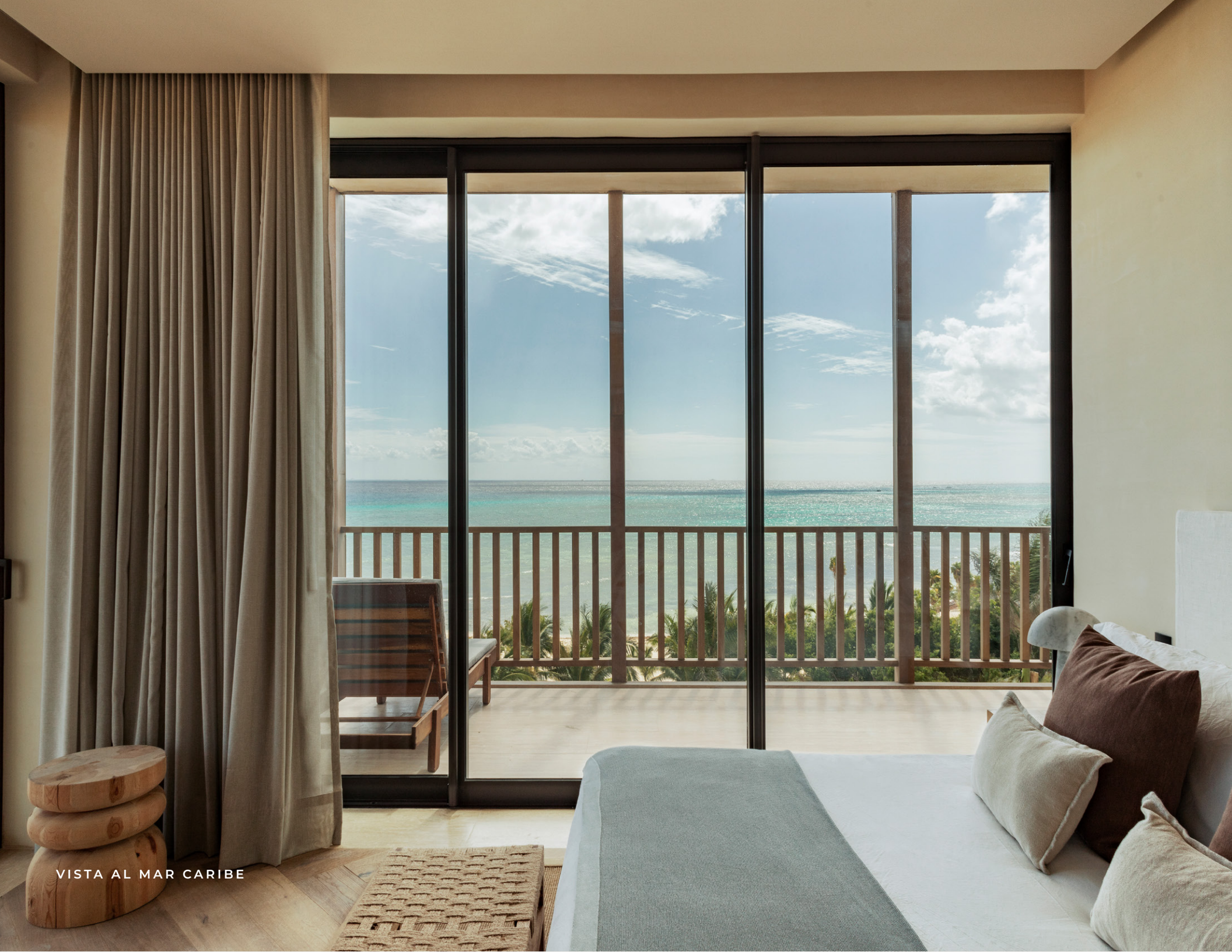
VISTA AL MAR CARIBE